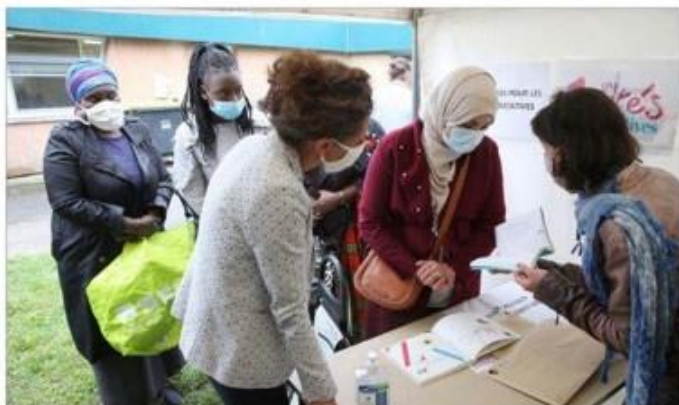
Les premiers ouvrages ont été donnés hier à des familles du quartier de Bel-Air.